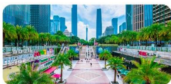
Quảng trường Hoa Thành