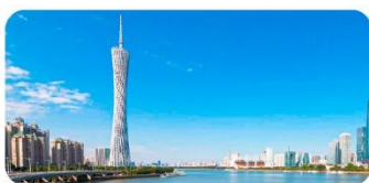
Tháp Quảng Châu