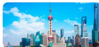
Tháp truyền hình Đông Phương Minh Châu