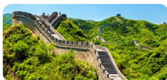
Vạn Lý Trường Thành