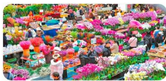
Chợ hoa Đẩu Nam