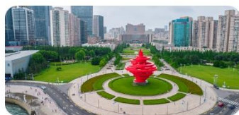
Quảng trường Ngũ Tứ