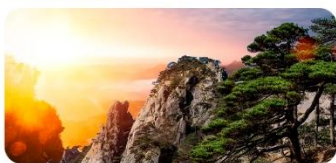
Chinh phục Núi Thái Sơn