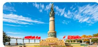
Tháp tưởng niệm chống lũ lụt