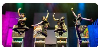
Hero Painter Show