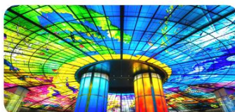
Trung tâm âm nhạc Cao Hùng