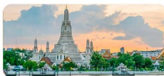
Chùa Wat Arun