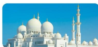
Thánh đường Hồi giáo Sheikh Zayed