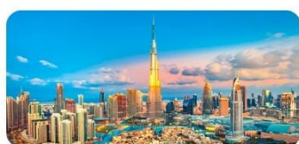
Tháp Burj Khalifa