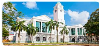
Nhà hát Victoria