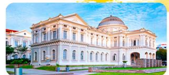
Tòa nhà Quốc Hội

➤ BỮA ĂN ĐẶC SẮC: BUFFET BBQ, CUA SÓT ỚT (CHILLI CRAB)