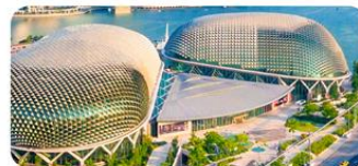
Nhà hát Esplanade